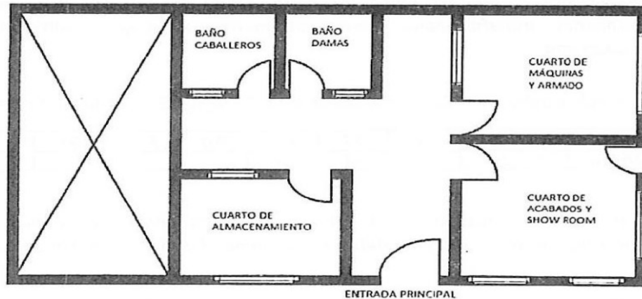
Figura 3. Croquis empresa Exopiel S.A.S

Se anexa información suministrada por el usuario por medio del radicado 2023ER192128, en la que se observan las diferentes áreas con las que cuenta el inmueble en mención: